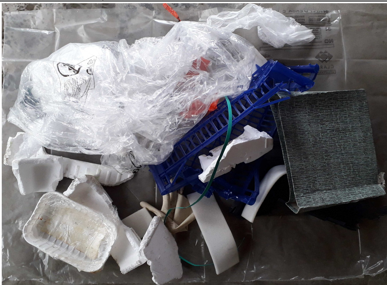
CAMPIONE MEDIO COMPOSITO